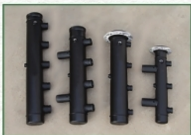
قطر انشعاب (میلی متر)